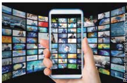
Wie verändern Netflix und Co. die Gegenstände der Filmwissenschaften?

Das Graduiertenkolleg am Institut für Theater-, Film- und Medienwissenschaft ist